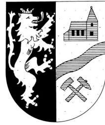
Das Wappen der Ortsgemeinde Neuerkirch